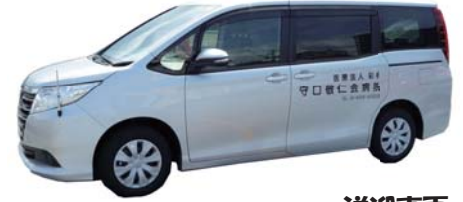
送迎車両 トヨタ /ア

停留所は門真ターミナルホテル前・京阪古川橋駅・大日駅ロータリーになります。 京阪門真市駅は 下車のみ です。下車する方がいない場合は止まりません。 土曜日は8便が最終になります。9便の運行は平日のみです。 ※乗車人数には限りがありますので、ご了承下さい。